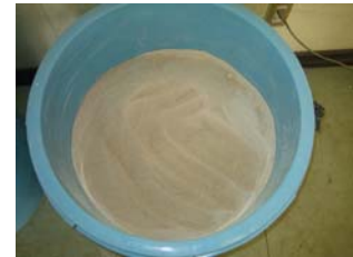
乾燥ふるい後完成