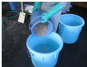
酢酸とカキ殻の混合

カキ殻と酢酸を反応させ、凍結防止剤を製造し冬季期間(12月～3月)に国道45号の一部を使用し効果実験を行います。