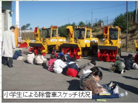
小学生による除雪車スケッチ状況

【凡例】 AT : オートマチック仕様車 MS : 凍結抑制剤散布装置 JL : ジョイスティックレバー 1WP : ワンウェイブラク SB : シャッターブレード VB : バリアブルブレード 視 : 視界改善型 MP : マルチブラク(汎用) VATG : バリア付トラックグレーダ装置