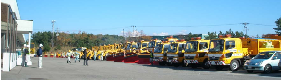
秋田河川国道事務所 除雪工区位置図