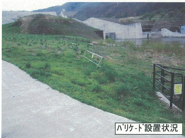
バリケード設置状況

○広瀬公園(福島市) 洪水吐流末側への進入の可能性があります、バリケードで立入禁止としました。