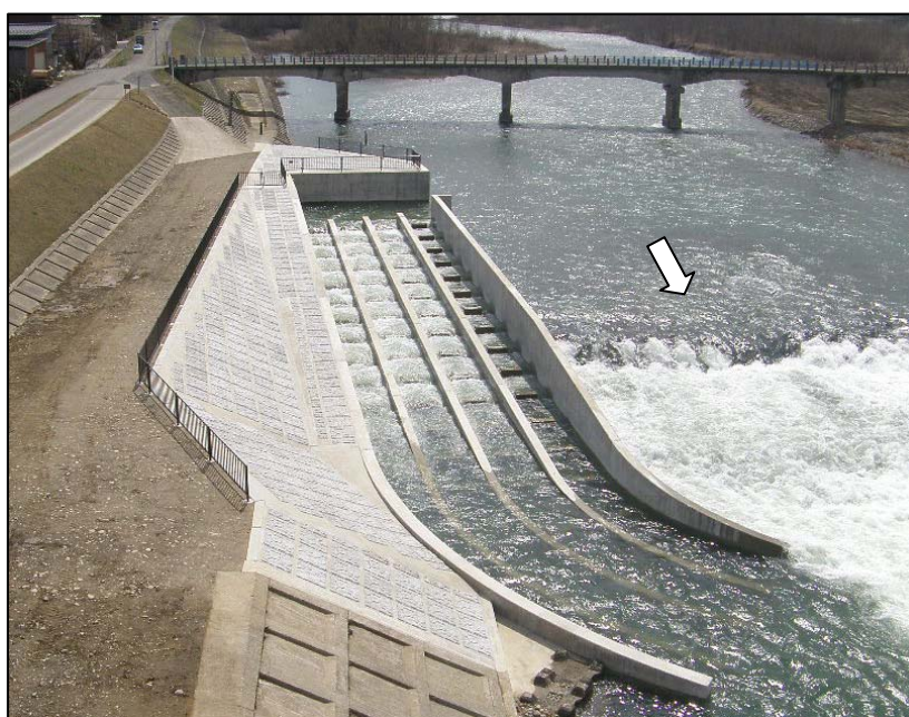
▲ 平成21年3月末の魚道完成直後の写真

魚道は様々な流況に対応するため高さの異なる4列(1列の幅2m)の魚道で構成されており、夏期の河川流量の少ない時期に特に効果を発揮します。