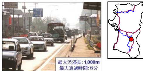
▲神宮寺駅入口交差点の渋滞状況