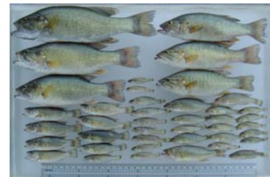
捕獲されたブラックバス類:成魚から幼稚魚までが出現する