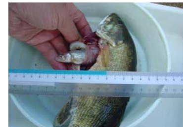
コクチバスの消化管から出てきたアユ