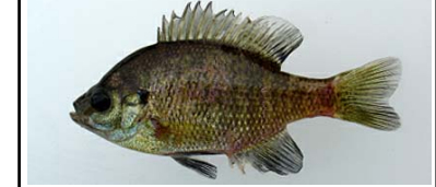
ブルーギル Lepomis macrochirus 湖沼や河川の岸際の流れの緩やかな水草帯を好む。主に全国の湖沼やため池などから報告

●ブラックバス類は、平成2年に伊達崎付近で始めて確認(国勢調査)されて以降、5年間でほぼ全域に出現し、その後も増加を続けています。 ●特に平成11年から16年にかけては、コクチバスが著しい増加傾向を示しており、在来魚への影響が懸念されます。