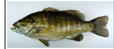
コクチバス Micropterus dolomieu オオクチバスよりも水温の低いところを好み、流れのあるところにも生息する。近年急速に河川への分布を広げており、既に阿賀野川水系、利根川水系でも報告(国勢調査)されている。