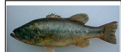
オオクチバス Micropterus salmoides 止水域を好む。主に全国の湖沼やダム湖から確認が報告されており、近年は河川でも増加している。