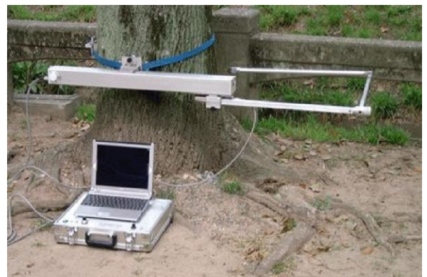
ガンマ線放射線法