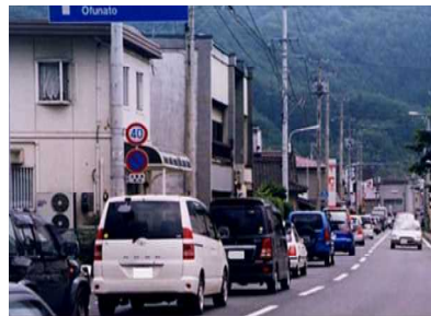
釜石市鶴住居地区の渋滞状況