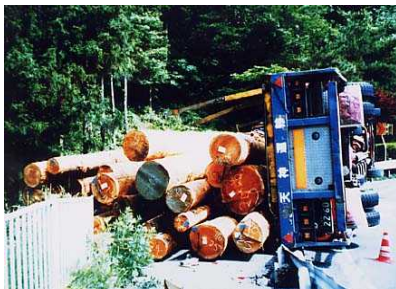
線形不良区間(恋の峠)での横転事故