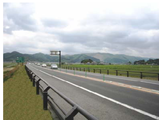
▲整備イメージ（供用済区間）