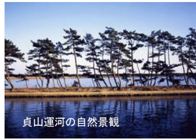
貞山運河の自然景観