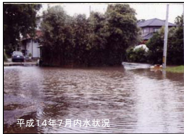
平成14年7月内水状況