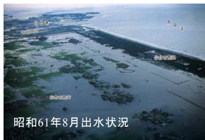
昭和61年8月出水状況