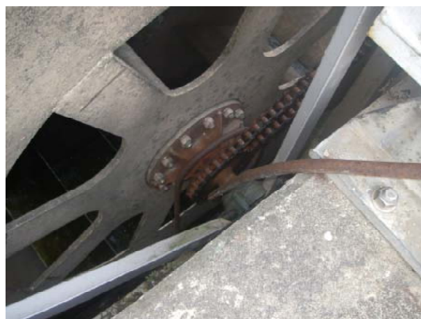
【除塵機回転軸部への鉄筋挿入】