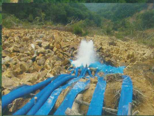
排水ポンプ稼働状況