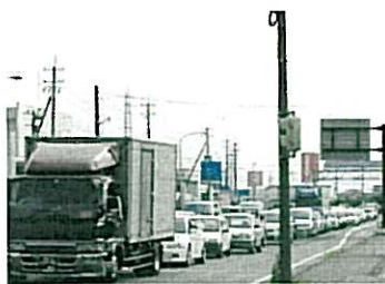
大宮交差点渋滞状況