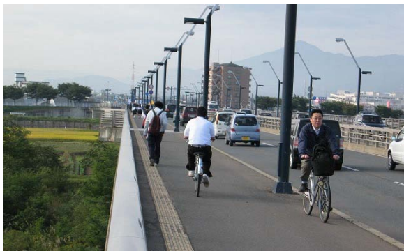
自転車と歩行者が混在して危険

【施行前】自転車は車道の路肩通行が原則となっていますが、自転車が走行するスペースが明示されていないため、歩道を走行する自転車が多く、人と自転車が輻輳して危険な状態です。