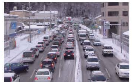
▲国道4号加賀野の朝の通勤渋滞