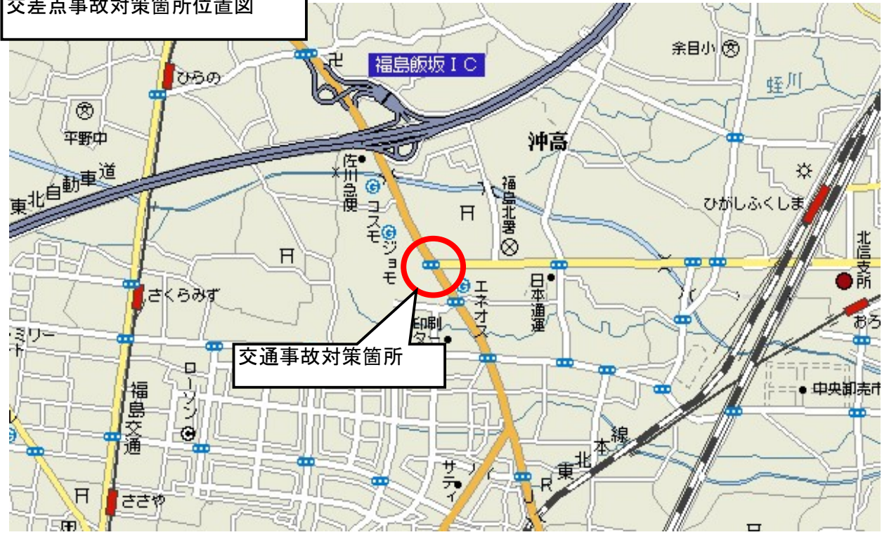
交差点事故対策箇所位置図