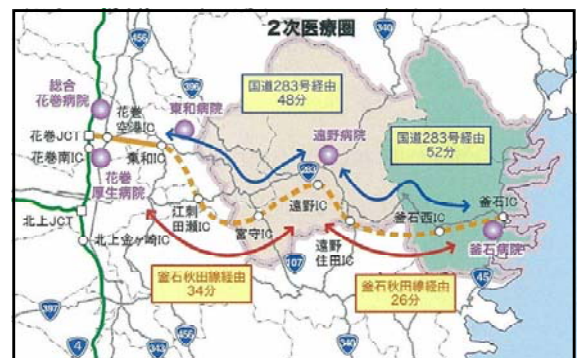
地域医療の連携強化