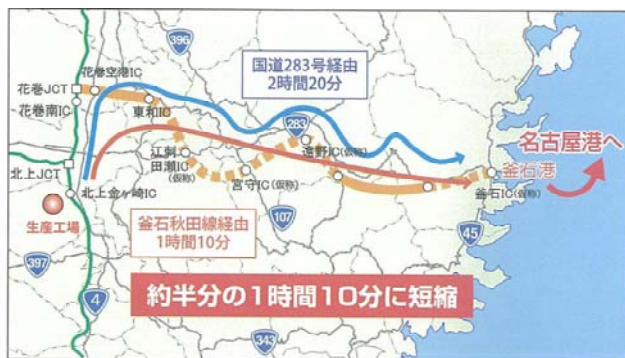
産業（物流）の効率化

沿線地域の観光入れ込み客数 (現状) 160万人 → (整備後) 210万人 <約1.3倍に>