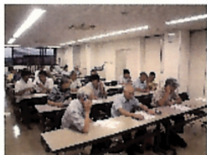
システム講習会状況写真