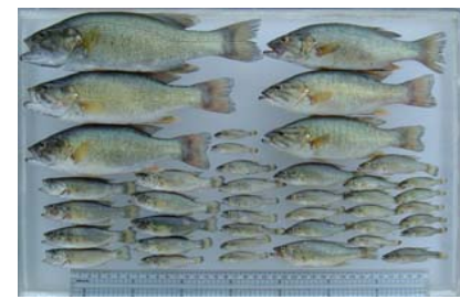
捕獲されたブラックバス類:成魚から幼稚魚までが出現する