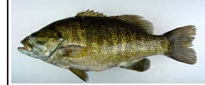
コクチバス Micropterus dolomieu オオクチバスよりも水温の低いところを好み、流れのあるところにも生息する。近年急速に河川への分布を広げており、既に阿賀野川水系、利根川水系でも報告(国勢調査)されている。