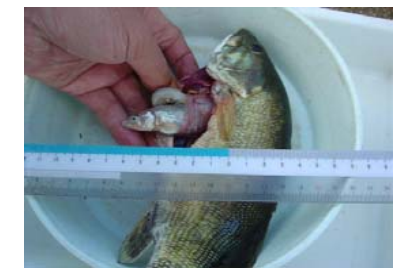
コクチバスの消化管から出てきたアユ