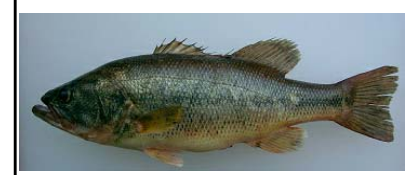
オオクチバス Micropterus salmoides 止水域を好む。主に全国の湖沼やダム湖から確認が報告されており、近年は河川でも増加している。