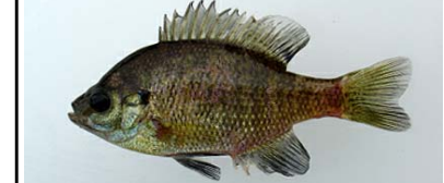
ブルーギル Lepomis macrochirus 湖沼や河川の岸際の流れの緩やかな水草帯を好む。主に全国の湖沼やため池などから報告されている。

●ブラックバス類は、平成2年に伊達崎付近で始めて確認(国勢調査)されて以降、5年間でほぼ全域に出現し、その後も増加を続けています。 ●特に平成11年から16年にかけては、コクチバスが著しい増加傾向を示しており、在来魚への影響が懸念されます。