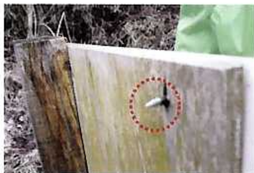
看板裏側からビスが突き出ている (玉川村・乙字水辺の小楽校)