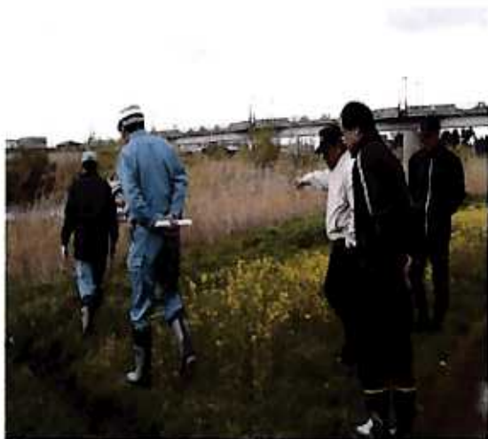
(日出山水辺の小楽校・郡山市)