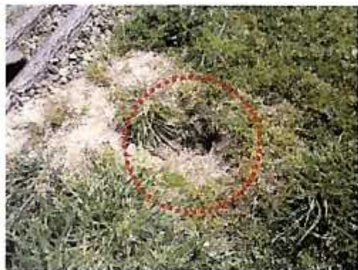
階段天端部分のへこみ (郡山市・日出山水辺の小楽校)