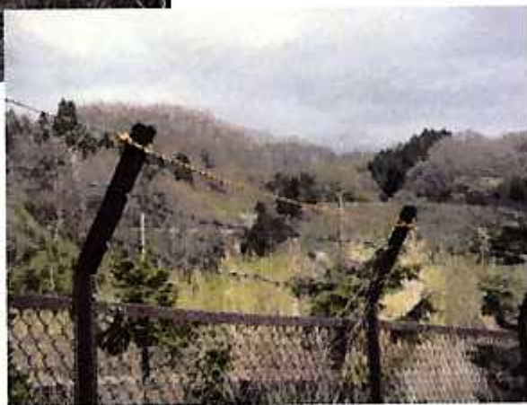
(三春町・蛇石前ダム) 切断して垂れ下がっていた有刺鉄線を撤去し、 ロープで応急復旧