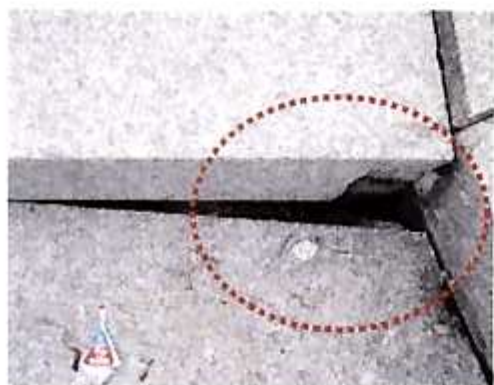
階段部に隙間あり (伊達市・広瀬川川原ステージ)