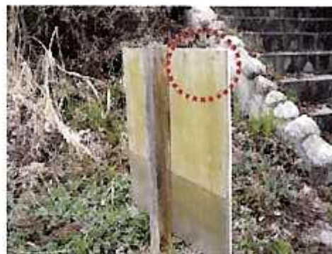
ビスの突き出しを削る