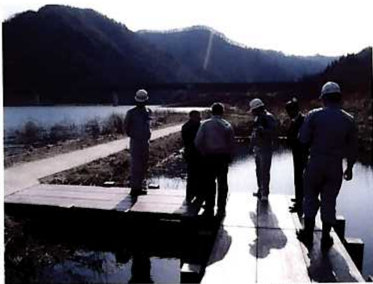
(福島市・名号地区環境整備地区)