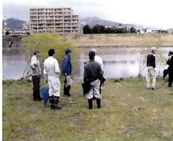
(渡利水辺の楽校・福島市)