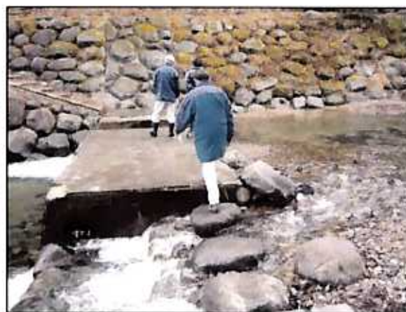
(東鴉川第一砂防堰堤・福島市)