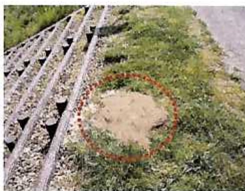
土を盛ってへこみを埋める