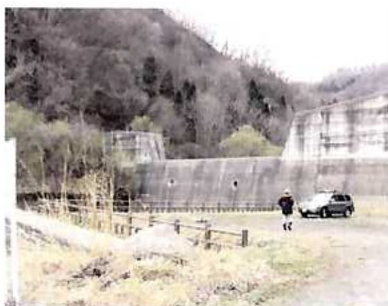
(天戸第一砂防堰堤・福島市)