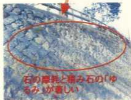
石の摩耗と積み石の「ゆるみ」が著しい

県都福島市の象徴である隈畔護岸は長年の風雪の影響で、護岸の積み石の「ゆるみ」や石の摩耗が著しく、また、水制については洪水の影響で一部構造の流出が顕著となり、不安定な状況となってきています。