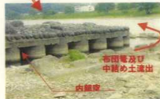
布田壁及び中詰め土流出 内陥