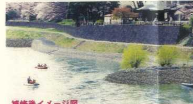
補修後イメージ図

今回の工事によりこれまで不安定であった石積み護岸と水制が安全で良好な景観となり隈畔地区が本来の姿を取り戻します。