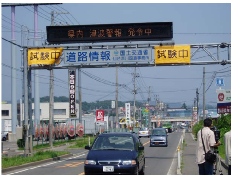
国道45号 宮城県塩釜市内における試験表示状況 (平成17年8月 報道機関向け現地説明会(仙台河川国道事務所主催))

千島列島の地震(H18.11.15)と千島列島東方(北西太平洋)の地震(H19.1.13)において太平洋岸に津波注意報が発令され、道路情報板ガイダンスシステムの動作を確認しました。道路情報板ガイダンスシステムを使用したことにより、津波注意報発令から4分以内で道路情報板に「津波注意報発令中」が表示されました。