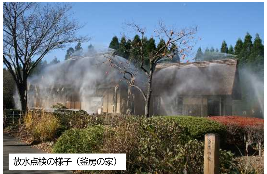
放水点検の様子(釜房の家)