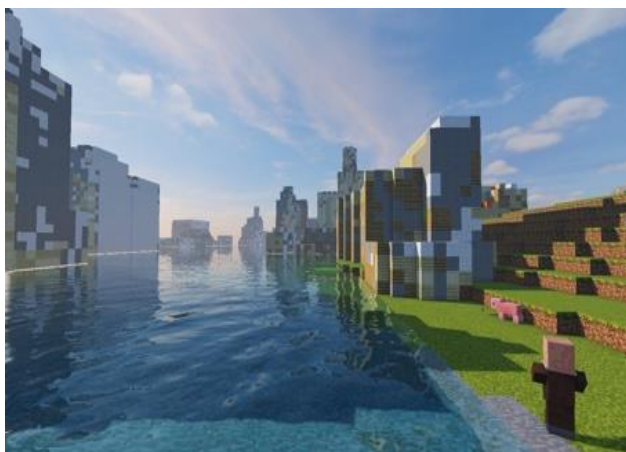
マイクラフトに浸水した街を再現