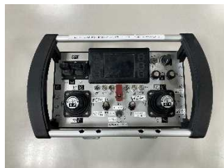
[遠隔操作コントローラー]