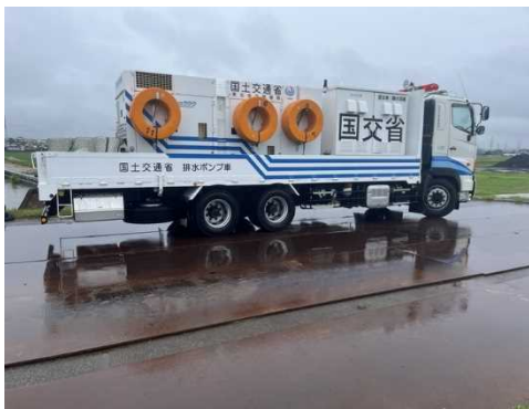
国土交通省排水ポンプ車（60m 3 /min）