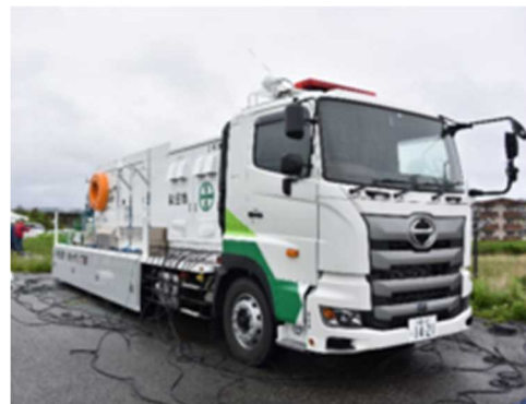
秋田市排水ポンプ車（60m 3 /min）