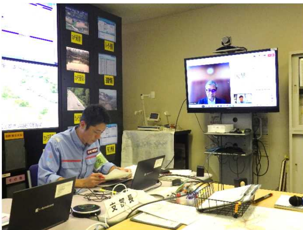
ホットラインによる情報伝達の状況