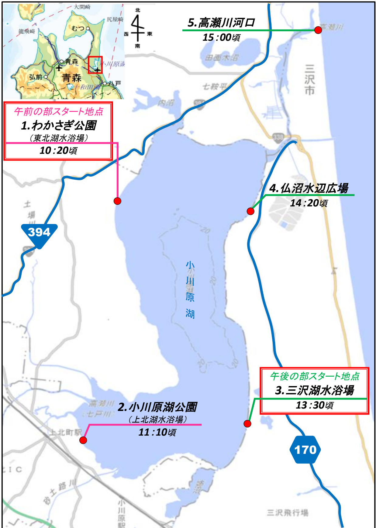
『地理院地図に安全利用点検箇所を追記して掲載』