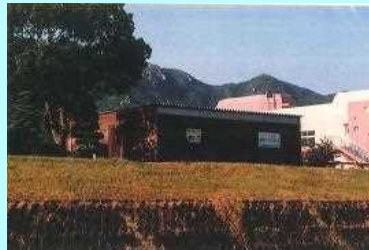
市民団体による活動拠点の整備事例（佐波川）