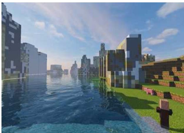
マインクラフトに浸水した街を再現