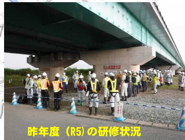
昨年度 (R5) の研修状況