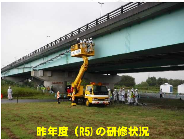
昨年度 (R5) の研修状況