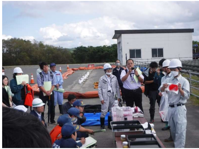
油及び油処理剤 の講習会