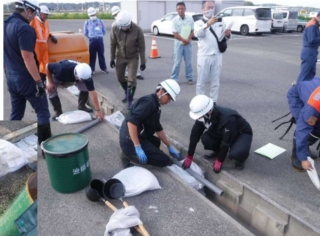
小水路(側溝)での 油回収訓練