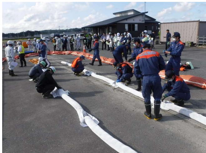
オイルフェンスの 組立・設置訓練