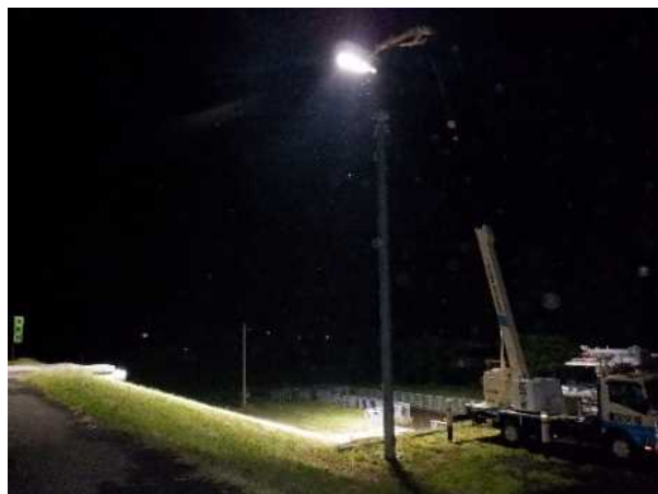
照明車による夜間稼働（大仙市） 期間：7月16日～17日