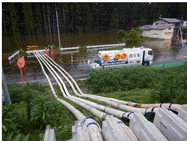
排水ポンプ車による排水作業（大仙市） 期間：7月16日～17日