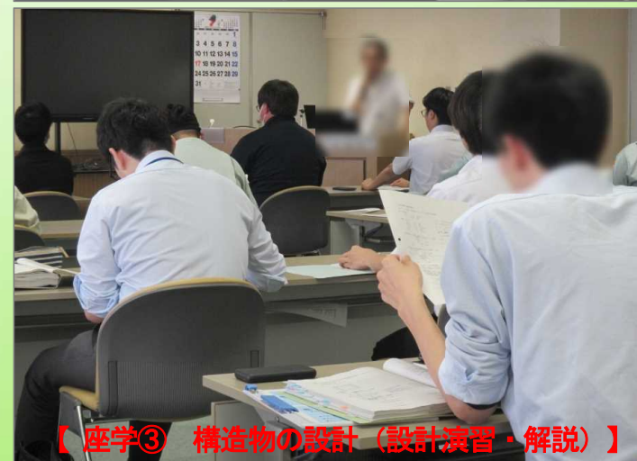
【座学③ 構造物の設計（設計演習・解説）】