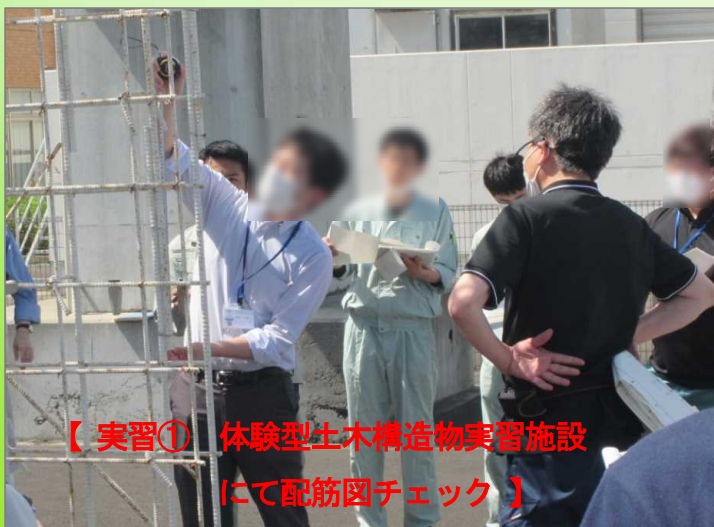
【実習① 体験型土木構造物実習施設にて配筋図チェック】