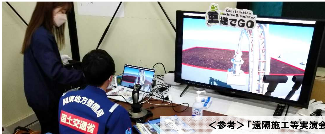
<参考>「遠隔施工等実演会」(施工DXチャレンジ2022)の様子