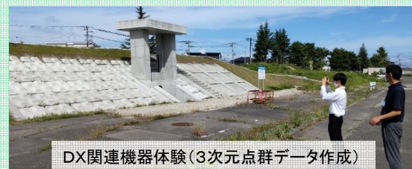
DX関連機器体験(3次元点群データ作成)