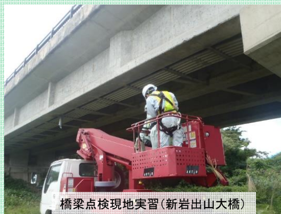
橋梁点検現地実習(新岩出山大橋)