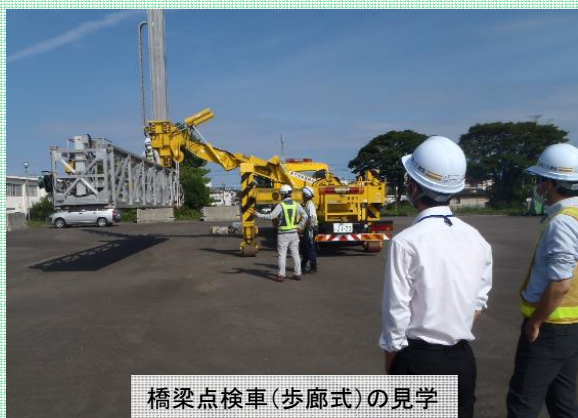
橋梁点検車(歩廊式)の見学