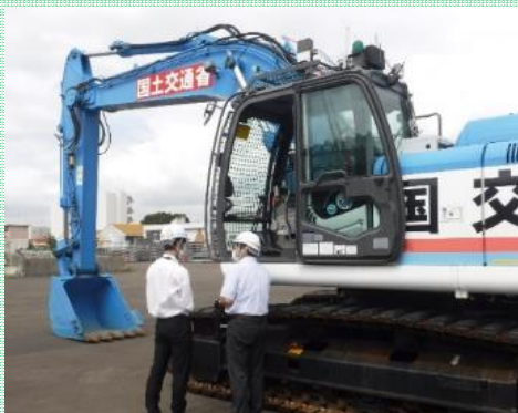
災害時に使用する遠隔操作式バックホウ

新着情報で9月7・8日にインターンシップを行ったことをご報告しておりましたが、新たに東北大学大学院よりインターンシップの実習生1名を9月12日～16日までの5日間、受け入れました。期間中、実習生には当事務所で取り組んでいる3つの支援(技術・人材育成・災害対策支援)を通じて、業務に理解を深めてもらうとともに、河川・道路管理、危機管理の重要性を認識していただきました。