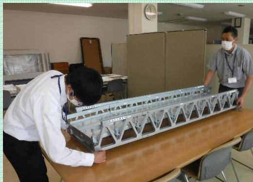
職員から模型を使った応急組立橋の説明