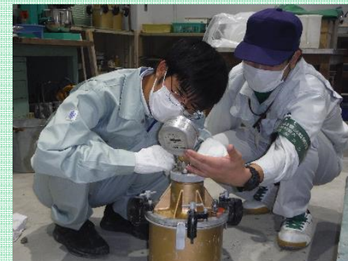
材料試験実習(コンクリート・空気量測定)