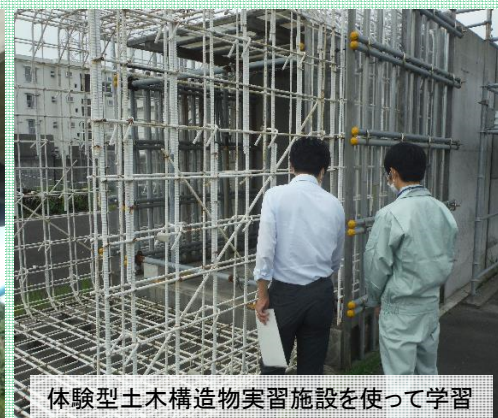
体験型土木構造物実習施設を使って学習