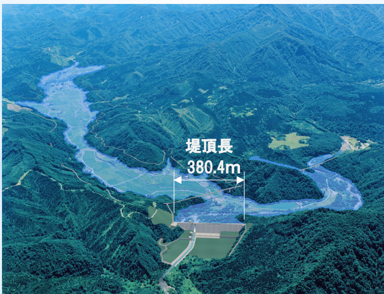
鳥海ダム完成イメージ