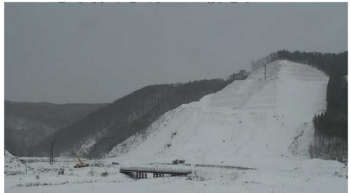
現在のダム建設地付近の様子

鳥海ダム工事事務所はより一層のコスト縮減を図りながら事業の早期完成を目指し、来年度も工事及び調査等に取り組んで参ります。