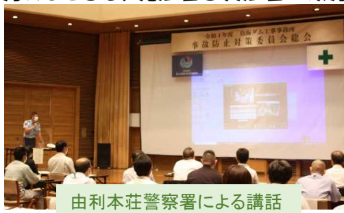
由利本荘警察署による講話