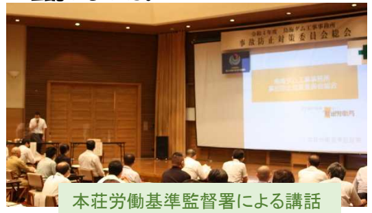
本荘労働基準監督署による講話