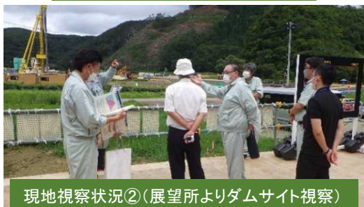
現地視察状況②(展望所よりダムサイト視察)