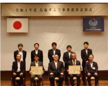
下請企業表彰受賞者記念撮影