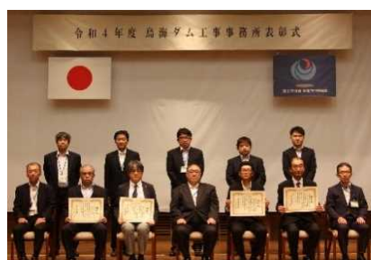
優良業務表彰受賞者記念撮影

今年度の鳥海ダム工事事務所における、局長表彰及び事務所長表彰の優良工事・優良業務・下請企業は右記のとおりです。