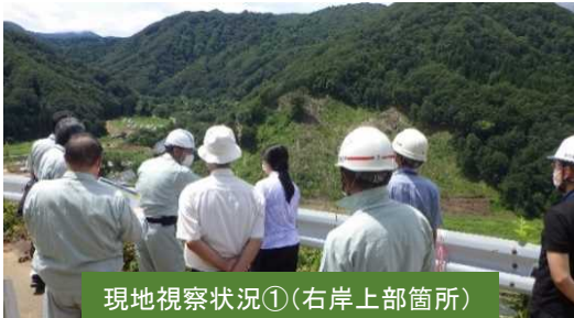
現地視察状況①(右岸上部箇所)