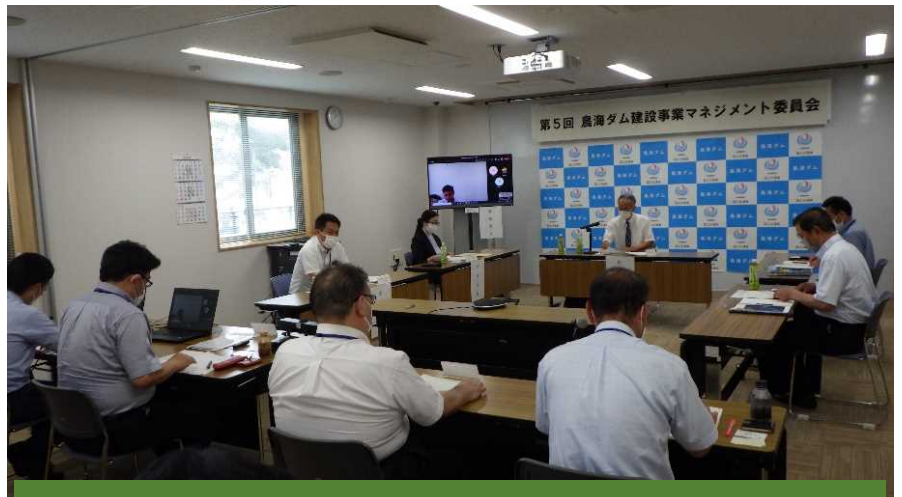
マネジメント委員会開催の様子

※新型コロナウイルス感染拡大防止対策のため、WEB方式併用、マスク着用、消毒、換気を徹底して開催。