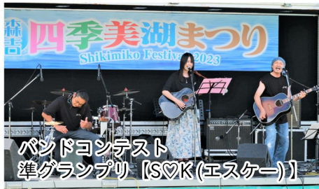
バンドコンテスト 準グランプリ 【S♡K(エスケー)】