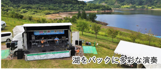
湖をバックに多彩な演奏