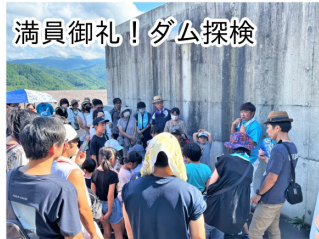
満員御礼! ダム探検