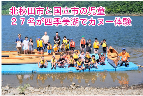
北秋田市と国立市の児童 27名が四季美湖でカヌー体験

北秋田市に伝わるマタギ文化を通じ命や食の大切さを学習するマタギの地恵体験学習会が2泊3日で実施されダムにも訪れました。