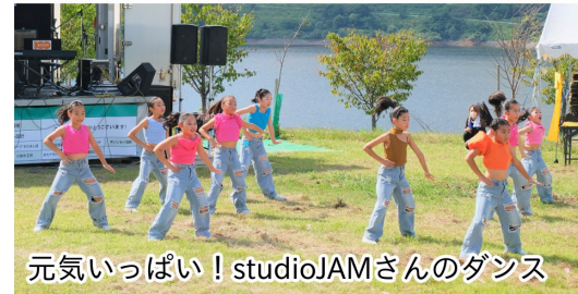
元気いっぱい! studioJAMさんのダンス

4年ぶりに飲食も解禁となった四季美湖まつりが開催されました! 晴天に恵まれ多くの家族連れが楽しんでいました。