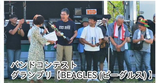
バンドコンテスト グランプリ 【BEAGLES(ビーグルス)】