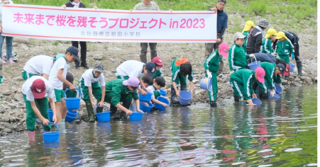
未来まで桜を残そうプロジェクト in 2023