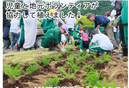
児童と地元ボランティアが協力して植えました↓