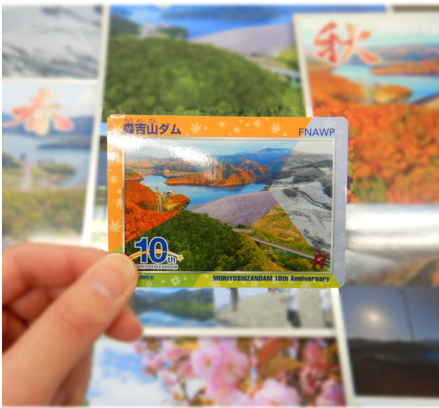
【10周年記念カード 年間配布枚数】