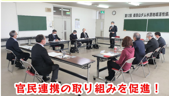
官民連携の取り組みを促進！

ダム周辺の活動を各首長に紹介し、来年度の方針案について、助言や提言をいただく協議会を開催しました。会では、引き続き連携しながら、四季美湖～市全体の知名度向上を目指していくことについて意見が交わされました。