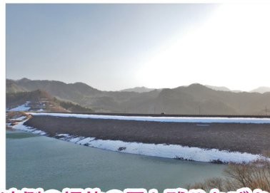
上流側の堤体の雪も残りわずか