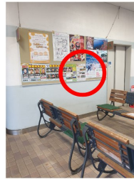
▲阿仁前田温泉駅様