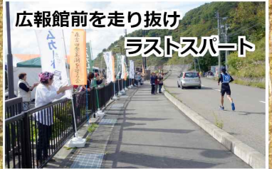
広報館前を走り抜け ラストスパート