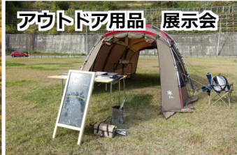
アウトドア用品 展示会