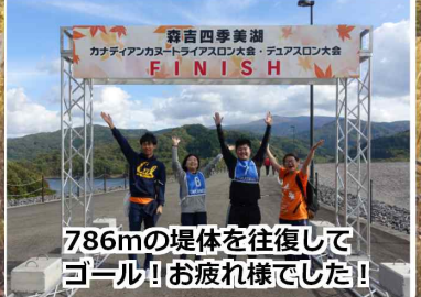
786mの堤体を往復して ゴール!!お疲れ様でした!!