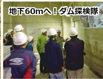
地下60mへ！ダム探検隊

イベントではダム探検隊や、ダム堤体登り、湖面を散策できるカヌー体験、そして6年ぶりに復活したイワナのつかみ取り。アウトドア用品の展示会や多彩なステージイベントも行われ、子どもからお年寄りまで楽しんでいる様子が見られました。