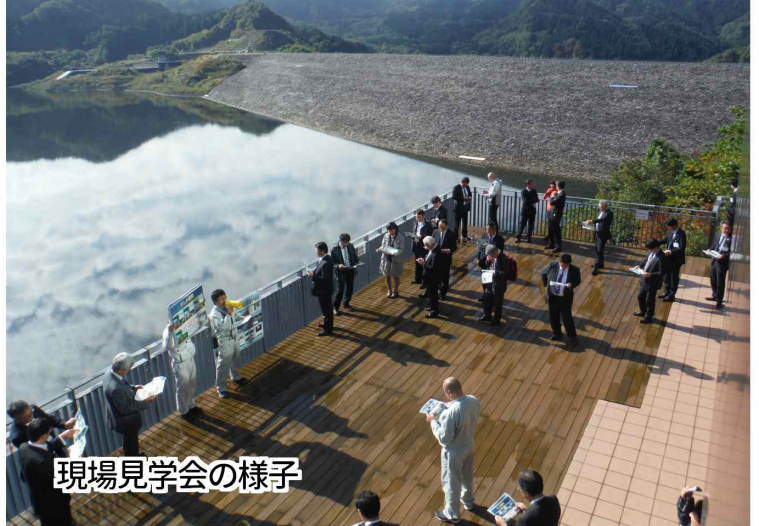
現場見学会の様子

10月12日(木)北秋田市民ふれあいプラザ コムコムにて「第9回みちのくダム湖サミットin森吉山」が開催されました。これは森吉山ダムの管理移行5周年を記念し、「水よし、森よし、地域よし。ダム湖がつなぐ地域の未来。」をテーマに、東北6県のダム水源地域の皆さん、北秋田市民ら約300名が参加し、ダム湖の活用方法などについて情報交換されました。来年のダム湖サミット開催地は四十四田ダムのある盛岡市で開催予定となっています。