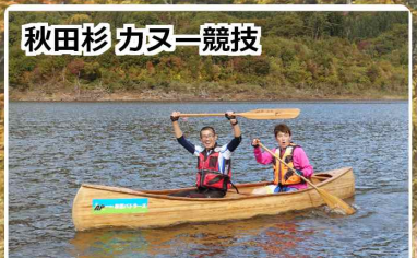
秋田杉 カヌー一競技

同日開催となった第1回森吉四季美湖カナディアンカヌートライアスロン&デュアスロン大会では合計14名の参加がありました。トライアスロン部門ではカヌー2 km 自転車26 km、ラン6 kmの絶景コースを全員が走りきり、非日常の世界を楽しむことができ良かったと話していました。