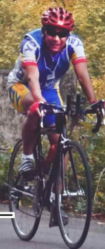
奥森吉・絶景の中を駆けるー