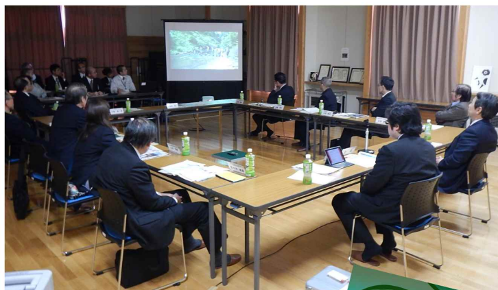
△ビジョン活動等を動画で紹介

3月17日（金）森吉山ダム水源地域ビジョンに則り、地域の状況や課題を把握し、解決するための各種方策や提言を行うことを目的とする「森吉山ダム水源地域活性協議会」が北秋田市前田公民館で開催されました。今年度の活動の効果として、実行委員会の活動により森吉山ダム・四季美湖周辺の情報発信がなされ、県内での認知度を向上させることができたこと。また、四季美湖周辺が日本最高レベルの野外活動エリアとして、北秋田市全体の財産であることを伝達するためにはイベント開催は効果的で、今後も続けていきたいとの報告がなされました。