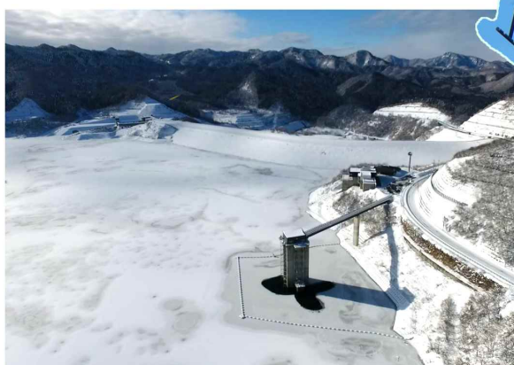
△上流側から見た森吉山ダム