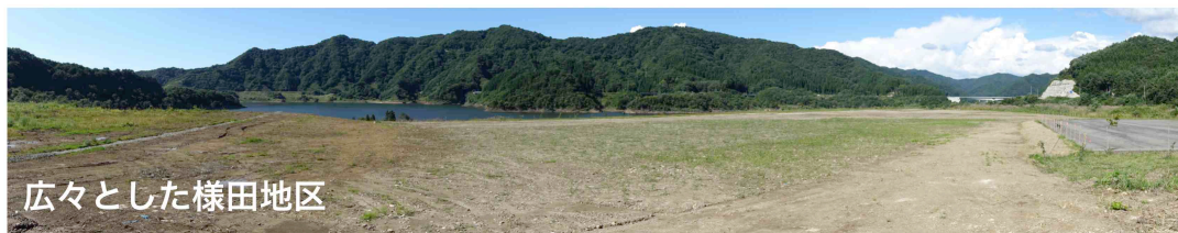
広々とした様田地区