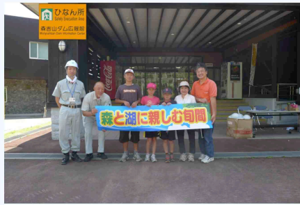
1回目の参加者6名のみなさん。初めての湖面巡視体験にドキドキ。

当日は北秋田市内から約20名の親子連れの方などが参加し、ダムの機能や役割を知っていただくとともに、豊かな自然環境にもふれあい、水源地域の魅力を知っていただく機会となりました。