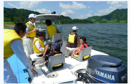
地元・根森田集落からの参加が多く、普段とは違ったダムの姿に驚かれていました。