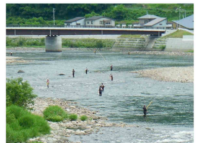
7月1日（火）森吉山ダム下流の阿仁川でアユ釣りが解禁されました