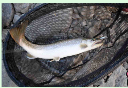
四季美湖で釣り上げられた大イワナ (42cm・仙北市 男性 提供)