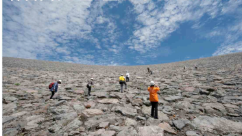
森吉山ダムを登ってみませんか？

新メニューとして今年から、湖面を秋田杉のカヌーで駆けるカヌーマラソン（男性6km、女性・男女混合3km）や、阿仁スキー場からゴンドラで森吉山を登り、旧森吉スキー場まで降りてくる絶景のウォーキングコースを予定しています！