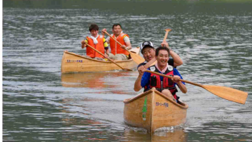
カヌーマラソン参加者募集中