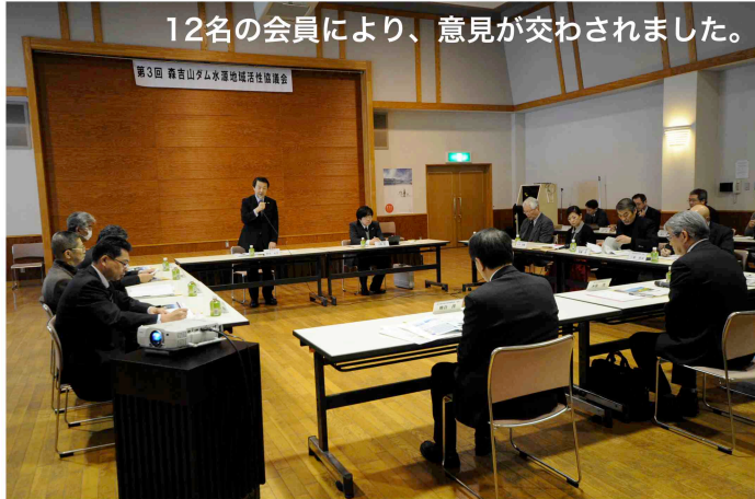
12名の会員により、意見が交わされました。

2月24日(月) 森吉山ダム水源地域ビジョンに則り、地域の状況や課題を把握し、解決するための各種方策・支援策を協議することを目的とした第3回森吉山ダム水源地域活性協議会が、コンベンションホール四季美館にて開催されました。