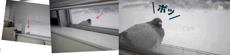
カメラ目線のハト。四季美湖と記念撮影後、すぐに飛び立ちました。

ダム堤体が雪に覆われたまま、寒さが続く森吉四季美湖周辺にハトがやってきました。管理庁舎の窓にちょこんと座り、こちらの様子を伺っているようでした。普段ダム周辺で、ハトを見かけることは少ないため珍しい来客となりました。